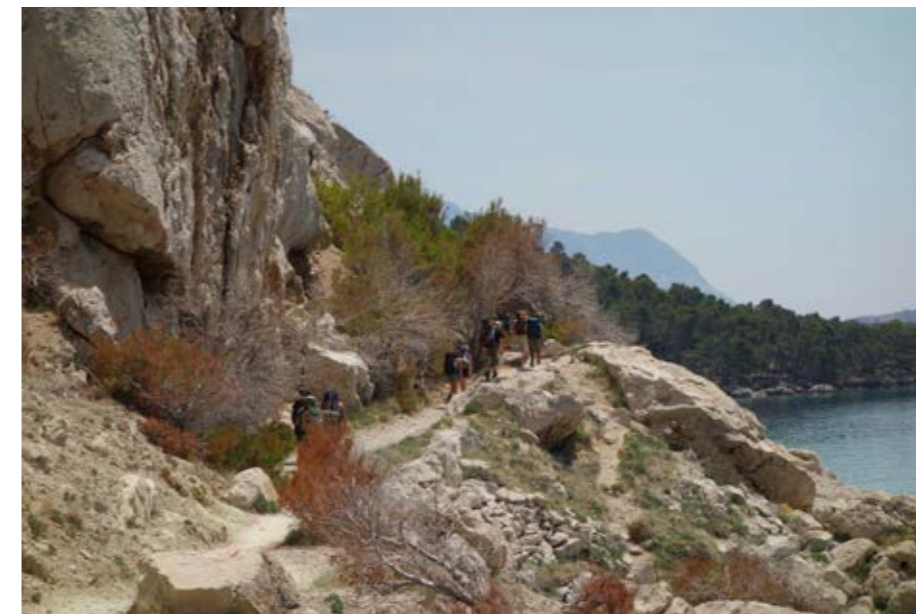
Küstenweg in Kroatien vorm ersten Badehalt