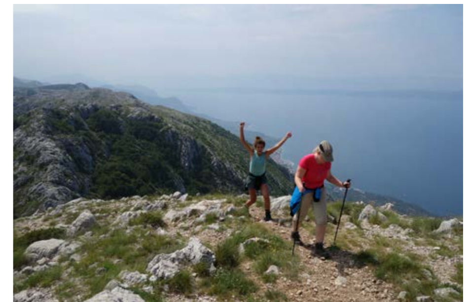
Der erste Gipfel im Biokovo-Gebirge auf 1.400 Metern ist geschafft, Start war in Makarska auf Meereshöhe