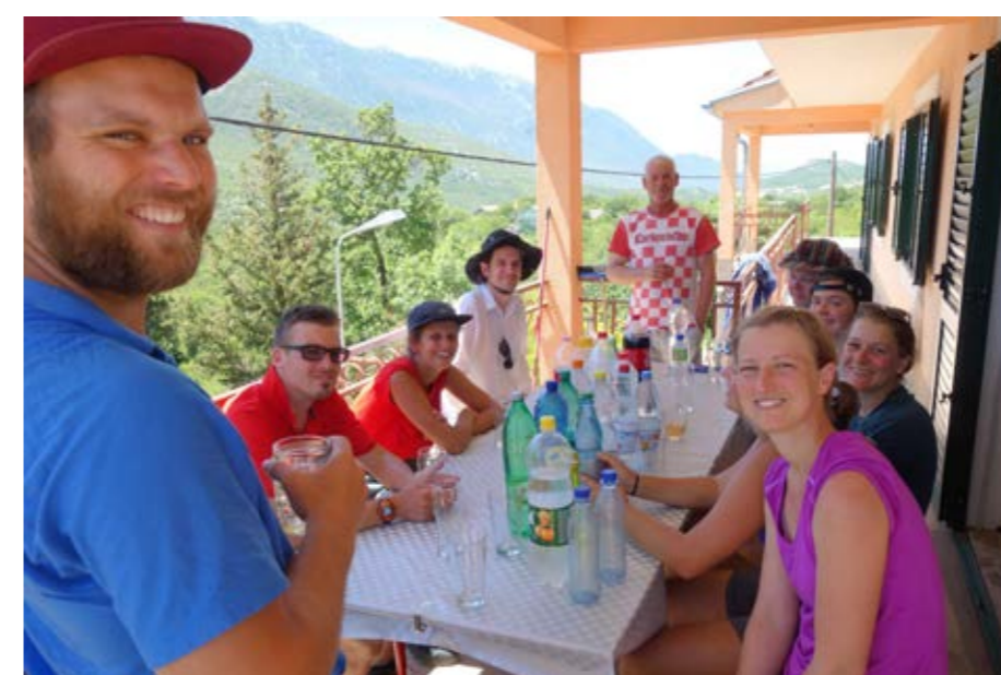
Nette Gastfreundschaft: Auch wenn gleich 24 Leute unerwartet „einfallen“, Getränke, Brot, Käse und Schinken gibt es für alle.