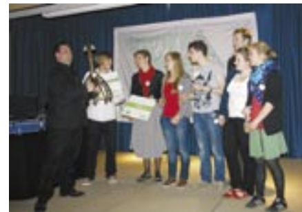
1. Preis Jugendgruppe