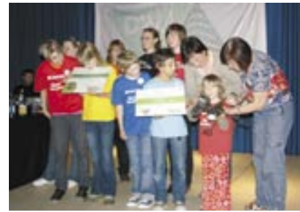
1. Preis Kindergruppe

Der Bundeswettbewerb Jugend wandert 2008 und das Abschlussfest war aus Sicht der Deutschen Wanderjugend ein großer Erfolg, auch wenn uns zwei Tage vor dem Fest eine sehr unerfreuliche Nachricht erreichte. Unser Kooperationspartner BKK 24, mit dem wir seit 2007 im Rahmen des Wettbewerbs zusammengearbeitet und für den wir umfangreich Werbung gemacht haben, hat völlig überraschend die Zusage für die Übernahme der Preisgelder und Fahrtkosten der Preisträger/-innen zurückgezogen. Umso mehr danken wir unseren anderen Kooperationspartnern für die zuverlässige Zusammenarbeit. Weitere Bilder und Berichte findest Du auf www.jugend-wandert.de .