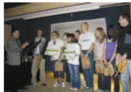
1. Preis Schulklasse