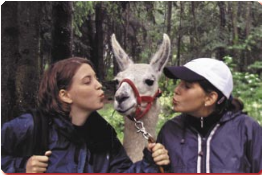
1. Preis: GPS-Gerät von Garmin für „Ich glaub mich knutscht ein Lama“

DWJ im Odenwald, Ortsgruppe Eppertshausen auf Lamawanderung.