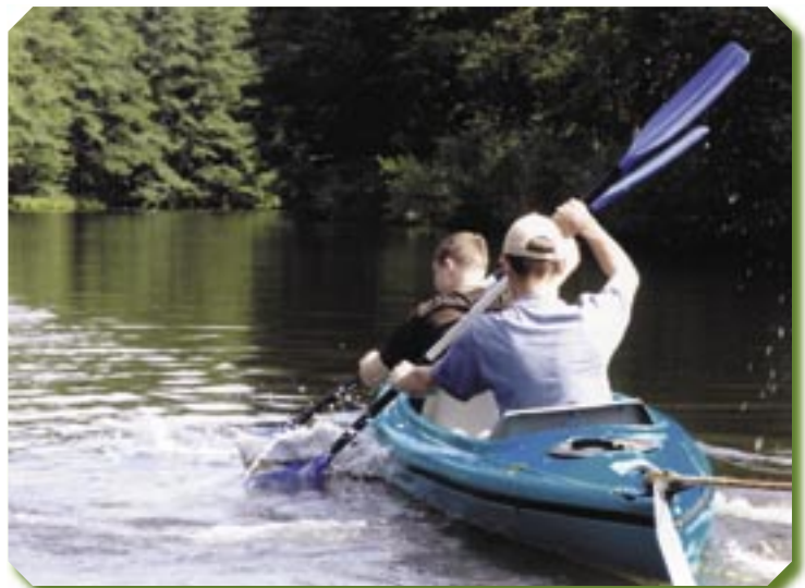
3. Preis: Buchpaket „Kooperative Abenteuerspiele“ für „Das Mädchenzelt“

Thüringerwald-Verein, Jugendgruppe Tabarz.